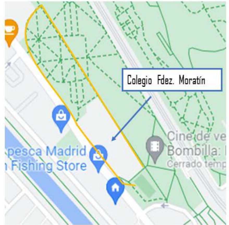
Recorrido 2 = 500 m