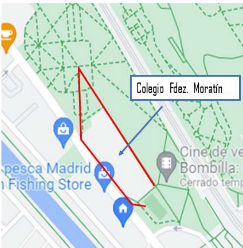
Recorrido 1 = 300 m